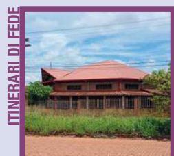
ITINERARI DI FEDE