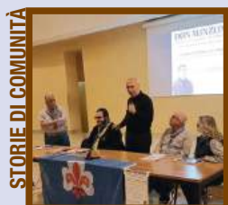
STORIE DI COMUNITÀ