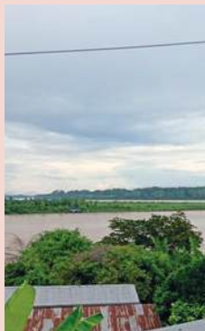
Il fiume Madre de Dios a Riberalta

muove, che ci fa sperare. Buon Natale a tutti! Un abbraccio di luce che illumini la storia che viviamo in tutte le sue dimensioni. Buona strada e buone sorprese!