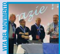
VITA DEL MOVIMENTO

Per scrivere alla redazione l'indirizzo mail è il seguente: redazione@masci.it