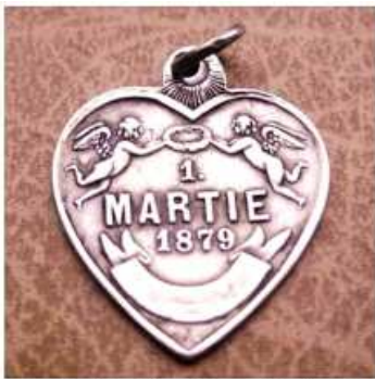
Cel mai vechi mărțișor din România datează din anul 1879 și are forma unei inimi din argint.

Am 1. März jedes Jahres erinnern auch die rumanischen Gilden im Verband AGGR an die Märtyrer der Befreiung des Landes von der osmanischen Herrschaft. Ein Symbol sind die Rot-Weißen Bändchen und ein historischer silberner Anhänger.