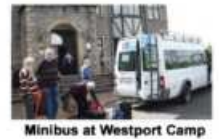
Minibus at Westport Camp