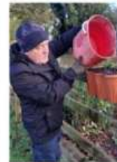
Gardening at Scout Campsite