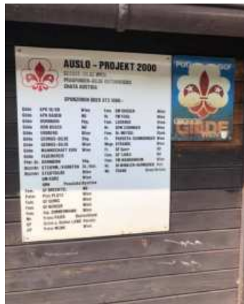
Pfadfinderhütte „Chata Austria“ mit Spenderliste und Gilde-Schild