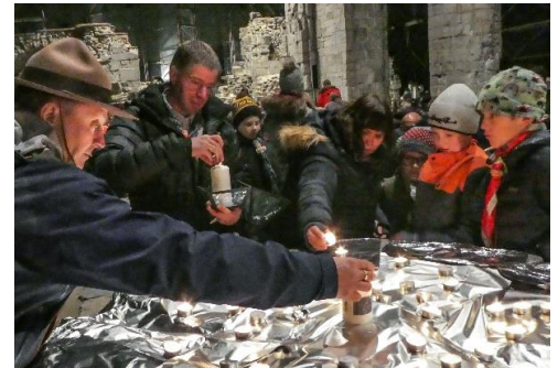
Passation de la lumière au capitaine du bateau à vapeur.

Pour des raisons de sécurité, l'usage des trains a dû être abandonné. Sans ce moyen de transport, les grandes distances à travers le pays représentent un véritable challenge. Heureusement, une solution a été trouvée récemment : le couvent Marias Minde à Bergen a accepté de maintenir les lumières continuellement allumées.