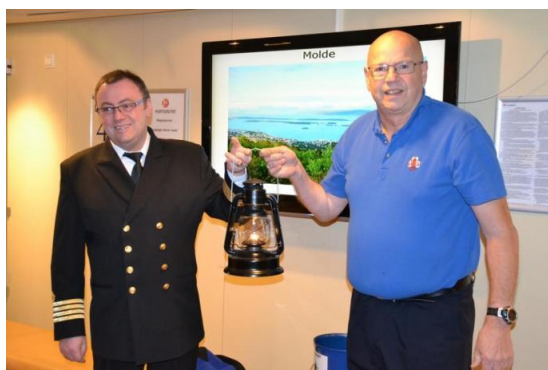
Distribution de la flamme dans la Cathédrale de Hamar

Ainsi, Oslo et ses alentours recevront leur flamme des voitures de Suède tandis que l'ouest et le nord de la Norvège accueilleront la lumière des bateaux à vapeur issus de Bergen.