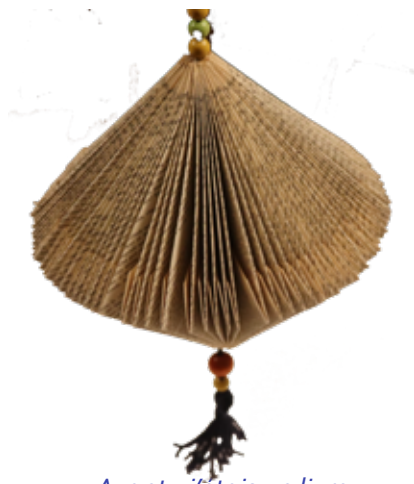
Avant - j'étais un livre

Il y aura beaucoup d'activités utilisant papier, fil, textiles, nature etc.