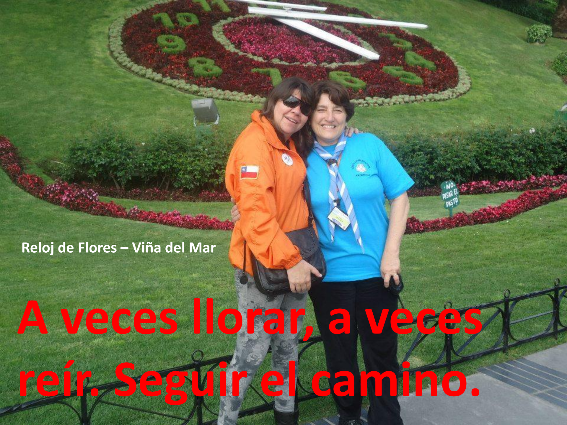
Reloj de Flores – Viña del Mar

A veces llorar, a veces reír. Seguir el camino.