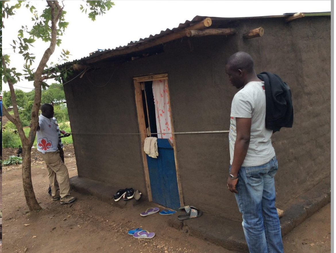
Exemple d'hébergement semi-permanent – Hutte construire avec des matériaux locaux