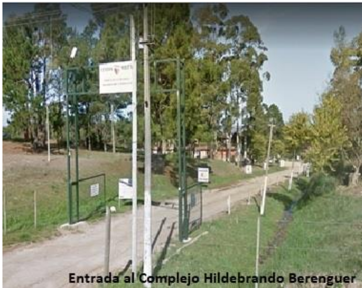
Entrada al Complejo Hildebrando Berenguer

Seguimos trabajando denodadamente para darles a nuestros futuros visitantes la mejor atención, en el que será nuestro segundo Encuentro en nuestro país.