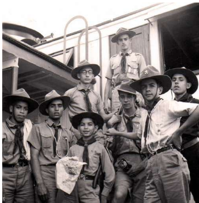
A bordo del "Zamora"

Entre octubre de 1935 y marzo de 1936 se fundaron en Caracas otras cinco tropas que, en orden cronológico de aparición, fueron: Sucre, Bolívar, San Pablo, Baden- Powell y Paraguay. Algunas unidades femeninas, pertenecientes a la Federación de "Girls Scouts" y a las "Guías de Venezuela", también estaban en plena actividad, así como unidades de Rovers.