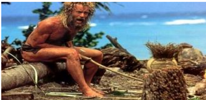
Fotograma de la película 'El naufrago' (2000), protagonizada por el actor Tom Hanks.

La soledad no es una buena compañía. Muchos son los estudios científicos que demuestran que tiene consecuencias negativas para la salud física y mental, tanto es así, que la APA (Asociación Americana de Psicología) compara los efectos nocivos del aislamiento con los del tabaco o alcohol.