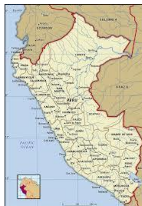
Pérou – Région de l'hémisphère occidental