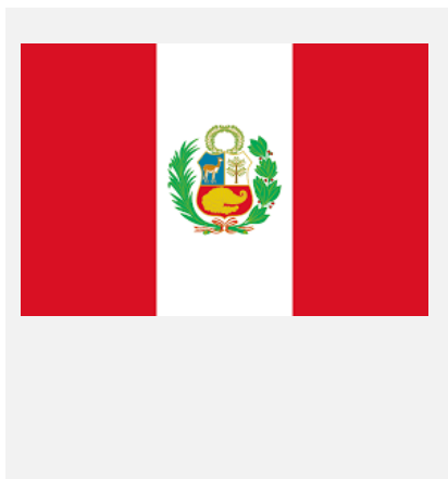
Peru – Western Hemisphere Region