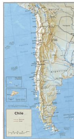
Chili – Région de l'hémisphère occidental