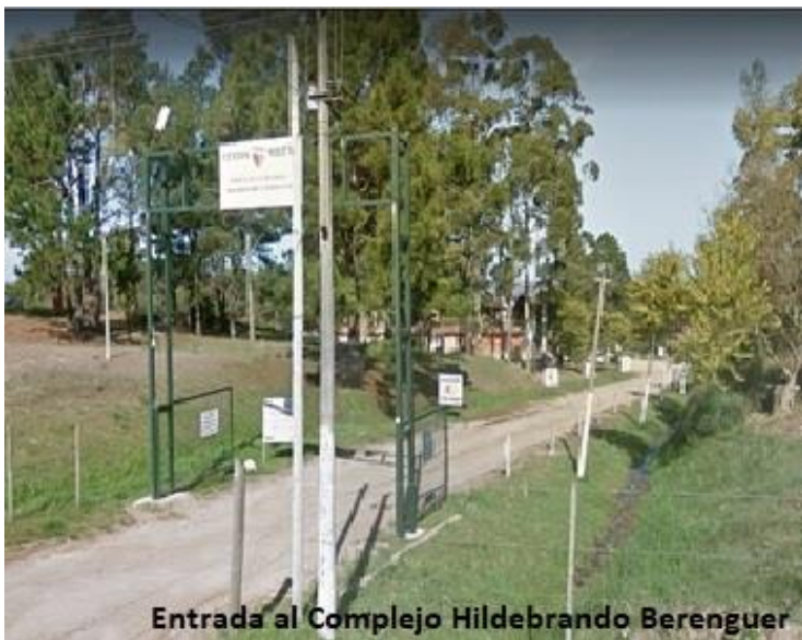
Entrada al Complejo Hildebrando Berenguer

Nous continuons à travailler très dur pour donner la meilleure attention à nos futurs visiteurs, dans ce qui sera notre deuxième Rencontre dans notre pays.