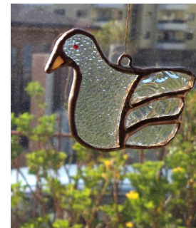
Icono de vidrio. Dimensión aprox. L. 6 cm x A. 5 cm